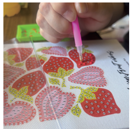
集中できる時間をもつことで 気持ちを落ち着ける (ビーズアート)