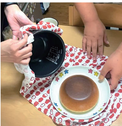
興味のあることにチャレンジ (お菓子作り)

*1) クライシスプランとは、心身の調子が悪くなった際に、どのように対応すればよいかを事前に考えておくための計画です。