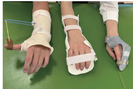
患者さんの手に合わせて、オーダーメイドの装具を造っています

か所あり、長野県内では当院が初めての認定施設となります。当院には手外科専門医が2名在籍しており、すでに日本手外科学会の認定研修施設としても活動しております。今後は、手の疾患でお困りの患者さんへの医療のさらなる充実に加え、ハンドセラピストの育成にも一層力を注いでまいります。