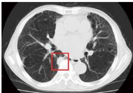
肺がん早期発見CT画像

ていくことになるでしょう。55歳以上の喫煙者は毎年必ず、受動喫煙者もCT検診を受けることをお勧めします。早期発見で、悪性病変はボヤのうちで退治することが肝要です。次回は、進行期で発見された肺がんについてお伝えします。