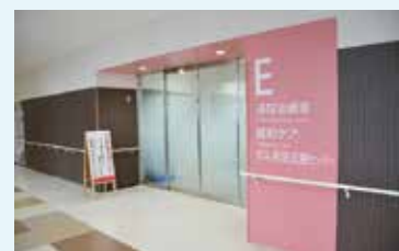
▲本館2階がん相談支援センター