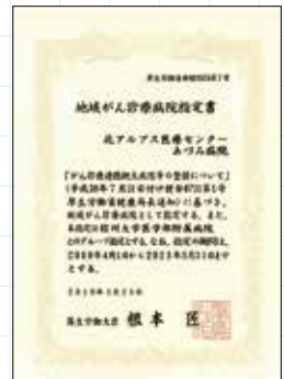
▲地域がん診療病院指定書

今回この指定を受けたことにより、職員の知識や技術等の向上に努めつつ、緩和ケアやがん相談支援・地域連携など、より充実したがん医療を大北医療圏の皆さまに提供できるよう努めてまいります。