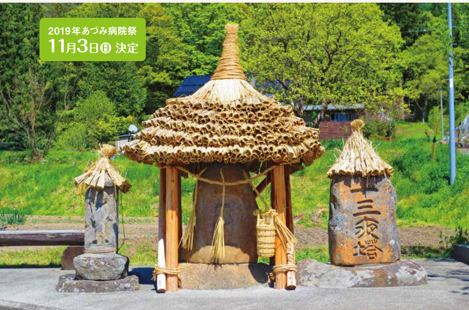
撮影：池田町 道祖神 相導寺