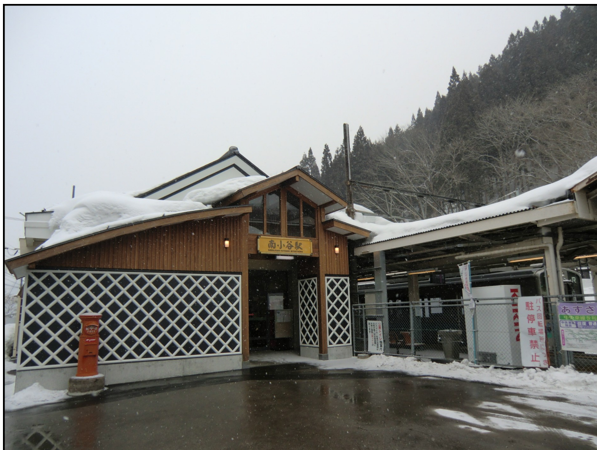
【JR大糸線（北アルプス線）の駅舎⑥「南小谷駅」（小谷村）】

北安曇郡池田町大字池田3207番地1 直通電話：0261-61-1455 直通fax：0261-61-1456