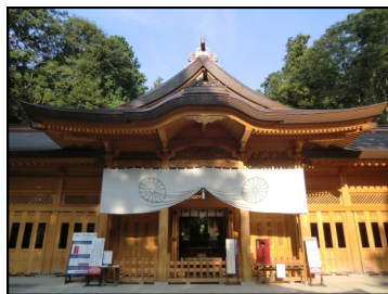
表誌の写真／新しい穂高駅は神社をモチーフとしています。こちらは新しくなった穂高神社です。 (2011.8月撮影)