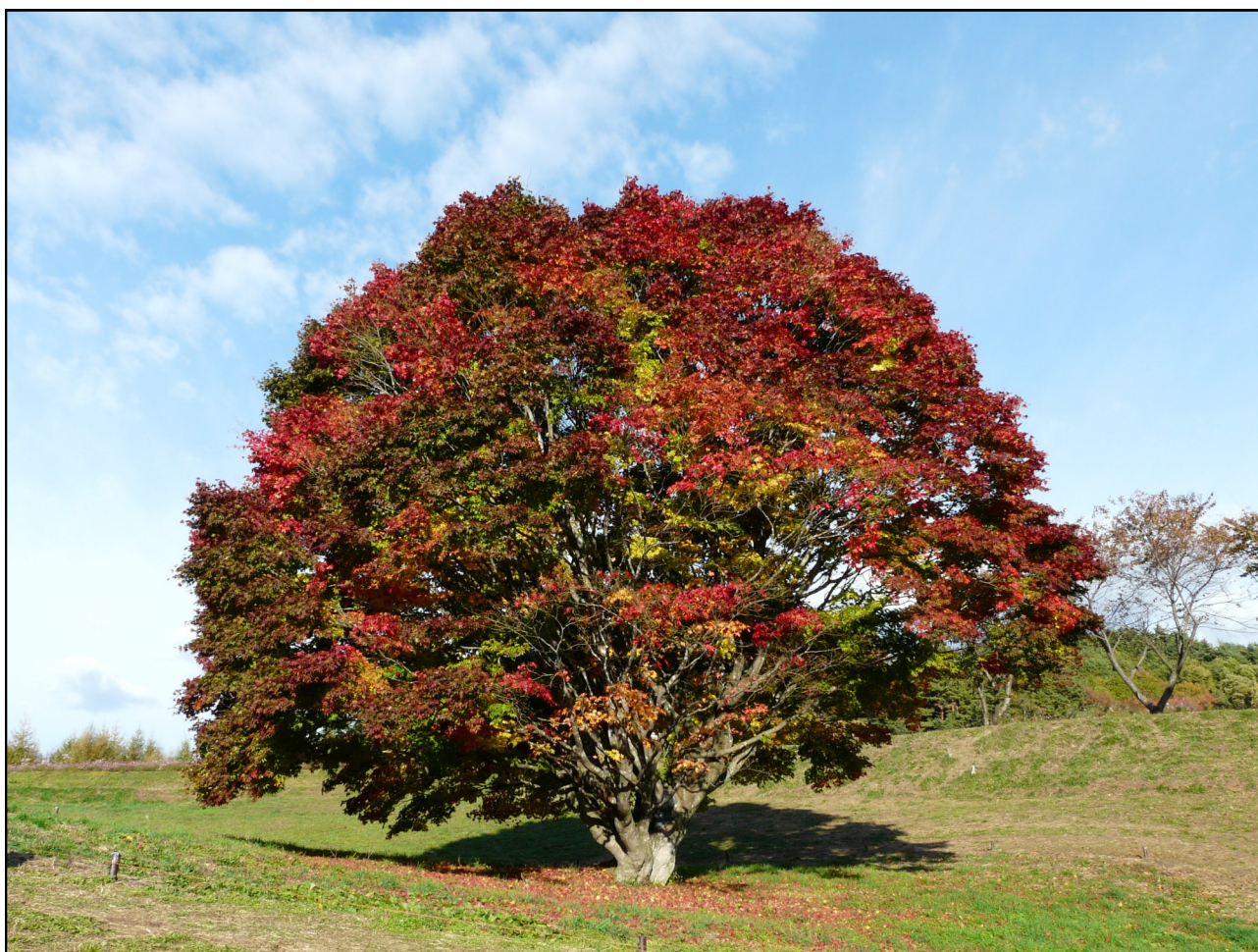
【大峰高原の大カエデ（池田町）】

北安曇郡池田町大字池田3207番地1 直通電話：0261-61-1455 直通fax：0261-61-1456