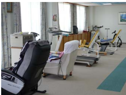
— 各種のリハビリ器械やトレッドミル。リハビリ室には寄贈のオルゴールがやさしい曲を奏でています

宮澤 脳卒中などの急性期にはリハビリを集中して行うのに、退院後はほとんどやらない。これではいけないと考えリハビリの導入をしました。介護保険が始まることで予防リハビリのプログラムを色々と考えました。リハビリを始める前に状態のチェックをし、3か月