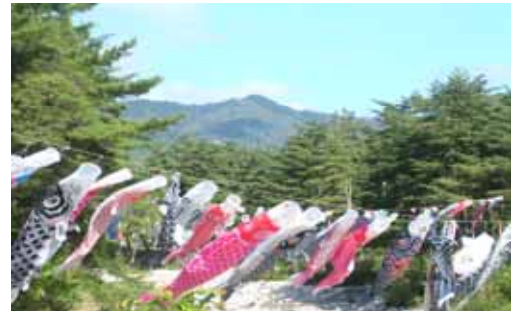
緑の風に泳ぐ 芦間川(松川村)