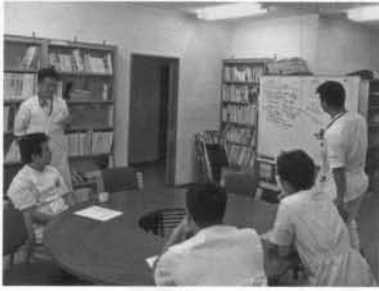
研修医による救急患者症例検討会

医師不足の話題は毎日のように報じられています。医師不足の原因が大学の医師が少なくなり、関連病院に派遣した医師を引上げたためといった報道があり、それは16年に施行された臨床研修医制度が原因し、大学付属病院を研修先に希望する学生が減ったからだと言われています。確かに現象面を捉えるとそのとおりでしょう。しかし、この変化は、この制度が①医師としての人格をかん養し②プライマリ・ケア（患者が最初に接する医療の段階）の基本的な診療能力を身につけるとともに③アルバイトせずに研修に