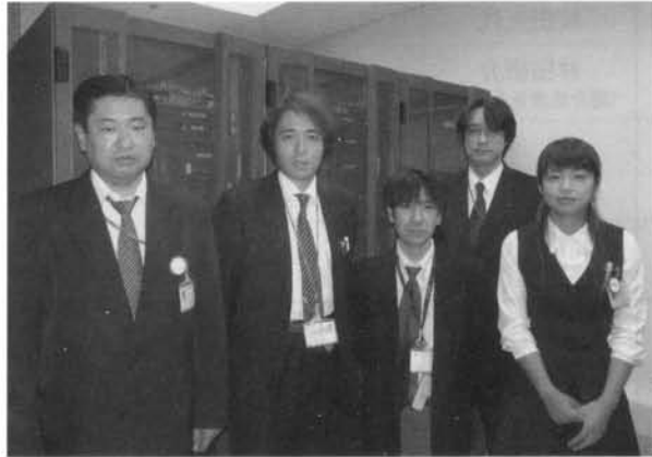
医療情報管理課のメンバー

医療情報管理課はこれらのシステムの監視・点検を日々行っています。また、コンピュータウイルスからの保護や個人情報流出を防ぐなどのセキュリティ強化にも取り組んでいます。