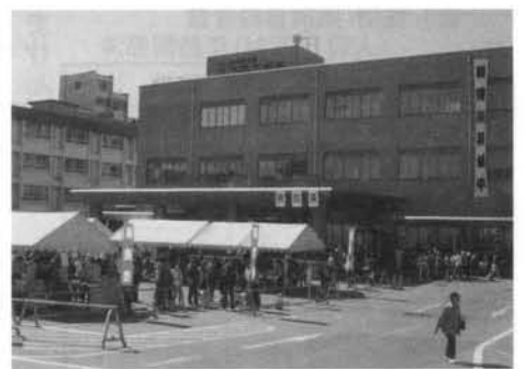
あずみ野市場のようす

講演として、精神科長村医師による「メンタルヘルスケアく不眠」と、山崎理学療法士による「メタボリックシンドロームからの脱出」の2講演が行われました。どちらも現代人が抱える身近で切実な問題だけに、多くの皆さんが熱心に聞き入っていました。ステージでは、「こ当地落語」「キッズダンス」「フラダンス」などが行われ、地域で活動する皆さんの発表の場として、車椅子や杖で来場された患者さん達からも、大きな拍手が贈られていました。また、「山人・里人の詩」コンサートでは、地域の身近な題材を取り上げ、地域に根ざした演奏活動をされているMENN☆Sのお二人の、あたたかでさ