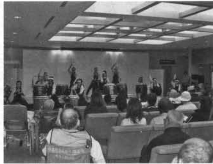
松川響岳太鼓 子供連

心配された空模様も、真つ青くみごとに晴れ、遠く雪化粧した北アルプスが映えわたる、秋晴れの10月21日、「安曇野ホスピタリティWatch With Me」ひとりにいるよ」のテーマのもと、第15回病院祭を開催しました。今年も、当院で以前から取り組んでいる「おもてなしの心」に「寄り添う心」をさらに添えて、患者さんやそのご家族、いつも周囲から見守ってくださる地域の方々へ、感謝の気持ちと、今後への意気込みをお見せしようと、職員一丸となり取り組みました。当日は、休